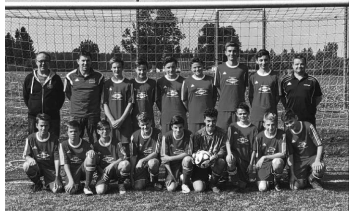
C1 - SGM Tannheim-Iller/Rot