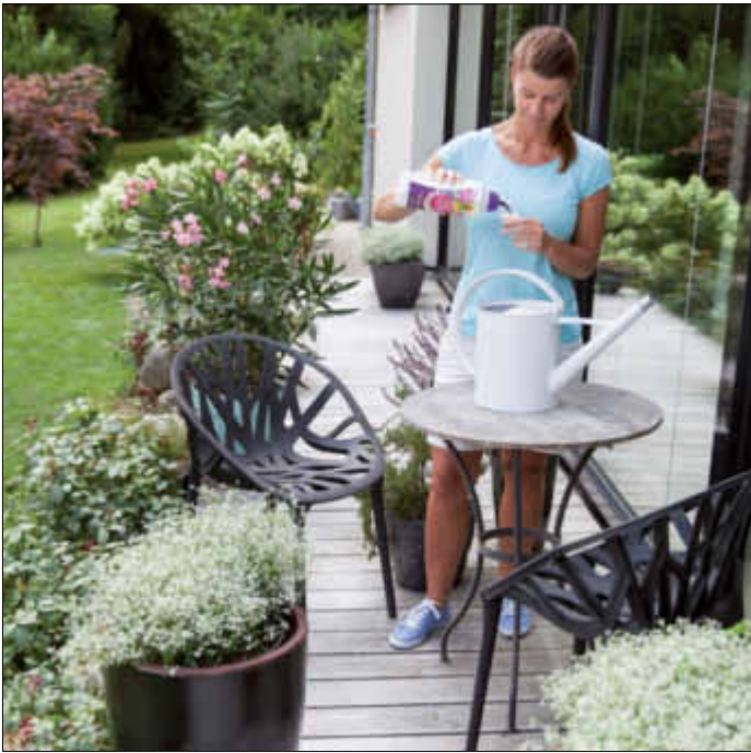
Langzeit Blumdünger versorgen Pflanzen sofort und bis zu 60 Tagen mit allen wichtigen Nährstoffen.