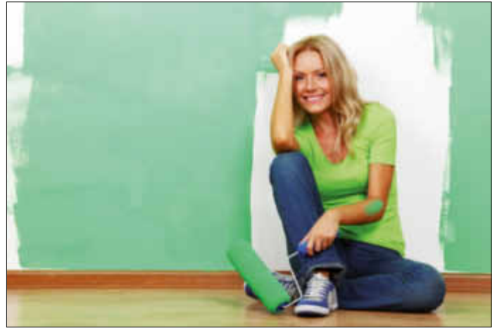
Schönheitsreparaturen und Renovierungsarbeiten selber zu erledigen, liegt im Trend. Wer sein Zuhause verschönert, sollte aber auf die versteckten Risiken achten.

verwendet einen Langzeitdünger. Zum Beispiel den Compo 60 Tage Langzeit Blumdünger. Dieser flüssige Langzeit Blumdünger wirkt vom ersten Moment an und dann weitere 60 Tage. Somit reichen zwei Anwendungen pro Saison, um eine lang anhaltende Blütenpracht und üppiges Blattgrün zu erzielen. Und das nicht nur im Haus, sondern auch auf Balkon und Terrasse. Die Dosierung ist einfach: Eine volle Kappe Blumdünger pro Liter Wasser reicht schon aus. Selbst empfindliche Pflanzen wie Orchideen, Sukkulente oder Azaleen können mit dem Flüssigdünger verwöhnt werden – allerdings in einer niedrigeren Dosierung. Die Rezeptur ist auf die unterschiedlichen Bedürfnisse abgestimmt und enthält alles, was für ein gesundes Wachstum notwendig ist. (wwp)