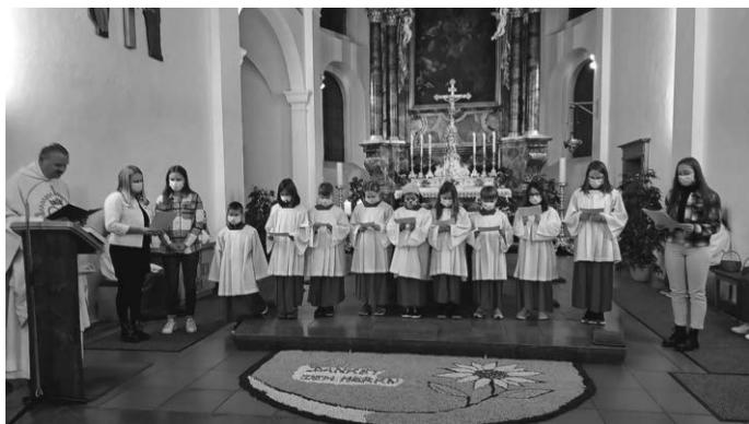
Die neuen Ministranten beim gemeinsamen Gebet.