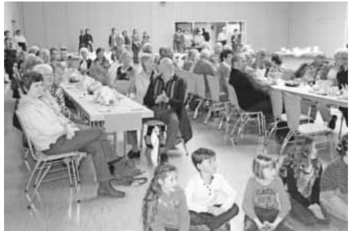
Ein gut besuchter Seniorennachmittag mit aufmerksamen Gästen