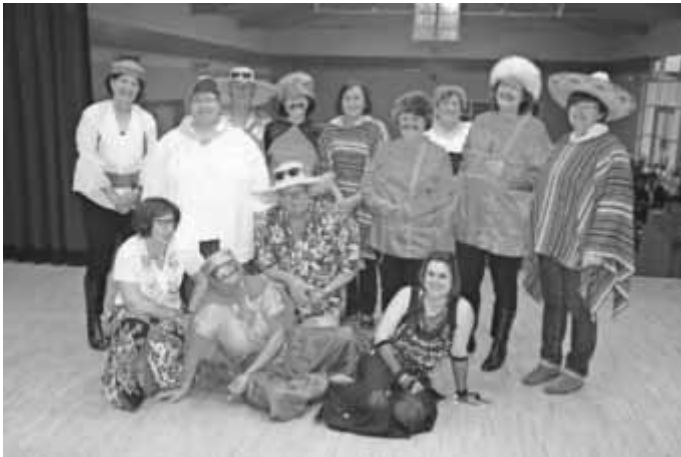
Musikalische Weltreise des Kath. Frauenbundes mit männlicher Unterstützung