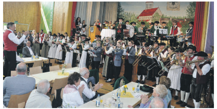
Die drei Tannheimer Musikkapellen bei ihrem gemeinsamen Auftritt in der Turn- und Festhalle in Tannheim im Schwarzwald.