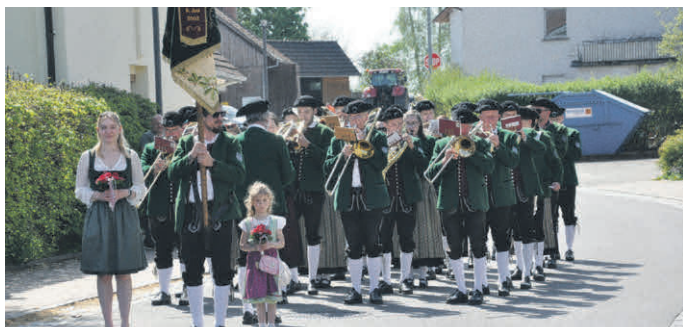
Die Musikkapelle aus Tannheim in Württemberg zieht in Richtung Turn- und Festhalle.