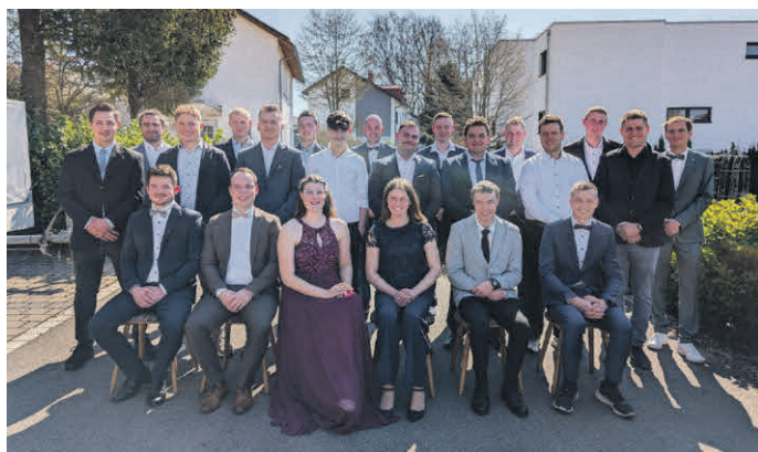
Die Absolventinnen und Absolventen der Fachschule für Landwirtschaft Biberach.