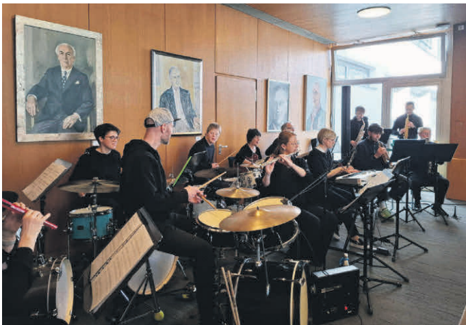
Der Fachtag wurde musikalisch von der inklusiven Band „Eintritt Frey!“ der Bruno-Frey-Musikschule eröffnet.