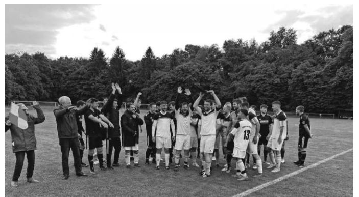
... und präsentiert ihn stolz seinem Team.