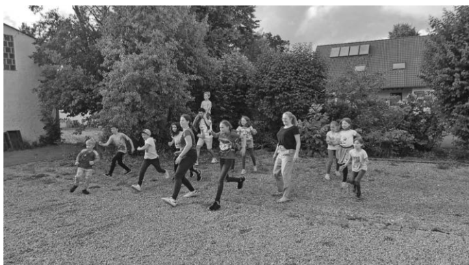
Viel Spaß rund um das Kirchengemeindehaus