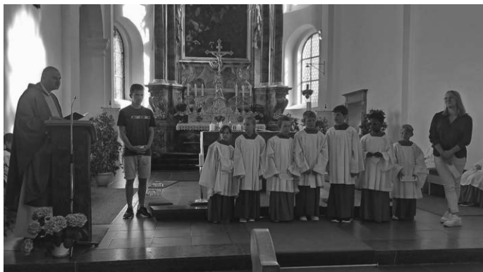
Die neuen Minis beim Segen

Ganz besonders möchten wir uns bei Getränke Wilhelm für die Spende der Getränke für unseren Miniabend bedanken.