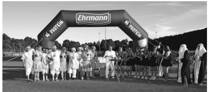
Die bestbekleidetsten Teams