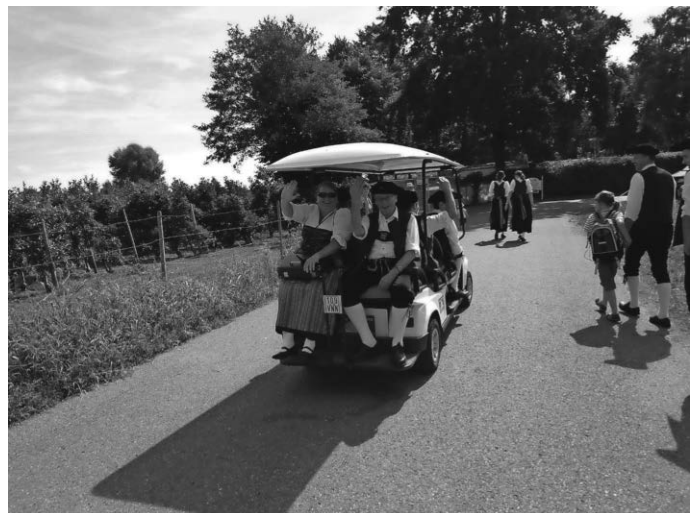
Wir sind dann mal in der Sommerpause