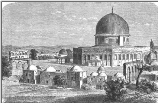
Tempelplatz, Jerusalem um 1880

Wer sein Kind an einem dieser Termine taufen lassen möchte, kann sich im Pfarramt Rot, Tel. 08395 - 936990, zu den üblichen Öffnungszeiten melden. Die Taufgespräche finden im Pfarramt in Rot statt.