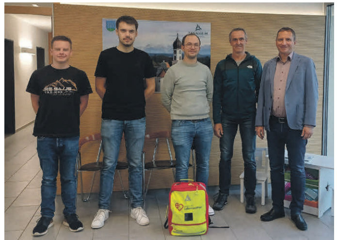
Bürgermeister Heiko De Vita (ganz rechts) bedankt sich bei Ehrenamtlichen der Initiative „Region der Lebensretter“, die im Notfall als Ersthelfer in Tannheim Leben retten.

Weitere Informationen und die Möglichkeit, selbst Lebensretter zu werden, finden Interessierte unter www.regionderlebensretter.de .