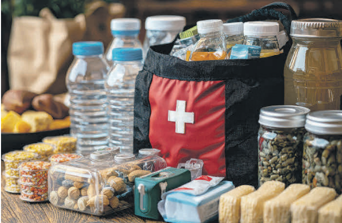
Das DRK Biberach bietet im November Kurse zur Vorbereitung auf Notlagen.

plötzlich begegnen können. Wer vorbereitet ist, kann sich und anderen in einer solchen Situation helfen. Die Bereitschaft, sich gedanklich mit einer möglichen Notlage auseinanderzusetzen, einen Plan zu erarbeiten und Vorbereitungen wie eine Mindestbevorratung zu treffen, bedeutet einen großen Schritt, um krisenfest zu werden. Mit dem Kursangebot „Vorbeugen und Reaktion auf Notlagen“ können sich die Teilnehmer umfassend über die notwendigen Maßnahmen und die geeignete Vorbereitung auf unvorhergesehene Notlagen informieren. Die Termine finden am Donnerstag, 6. November, Dienstag, 18. November, und Mittwoch, 19. November, jeweils von 19 bis 21.30 Uhr statt. Eine Anmeldung ist unter www.drk-bc.de unter „Kurse“ möglich.