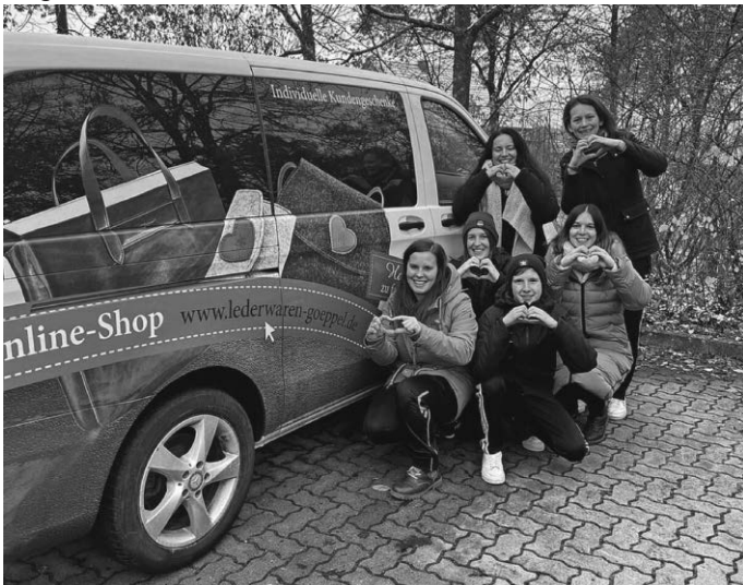
Die Tannheimer Damen danken vielmals für die schnelle Hilfe und das Ausleihen des Busses.

Ein großes Dankeschön will die Mannschaft noch an die Lederwaren Manufaktur Göppel übermitteln: Die Firma sprang schnell und unkompliziert ein und lieh der Mannschaft den Bus für die lange Fahrt nach Bad Staffelstein.