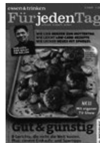
Für jeden Tag