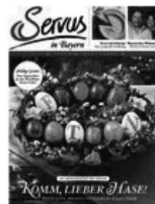
Servus in Stadt und Land

In unserer ONLEIHE könne Sie seit diesem Monat 5 neue Zeitschriften lesen: