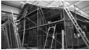
Restaurierung in der Halle