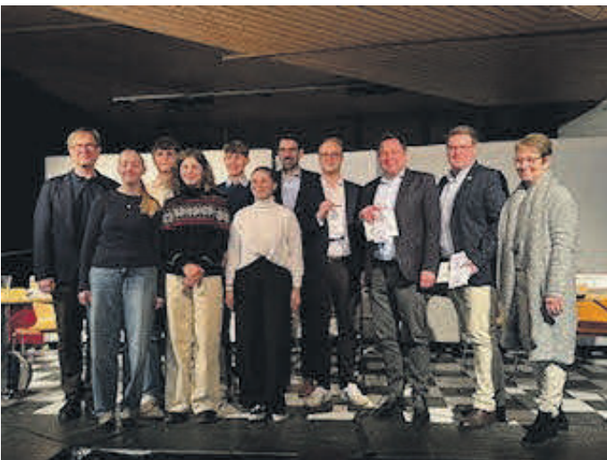
Vier Kandidaten für die Bundestagswahl stellten sich am GO den Fragen der interessierten Zuhörerschaft.