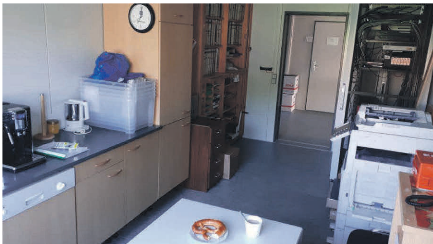
Einen Blick in den Bürocontainer: Multifunktionsraum mit Server, Kopierer, Lager, Küche und Miniaufenthaltsraum

Während der Sanierungszeit finden die Gemeinderatssitzungen im Filialistenraum direkt am Eingang der Grundschule statt.