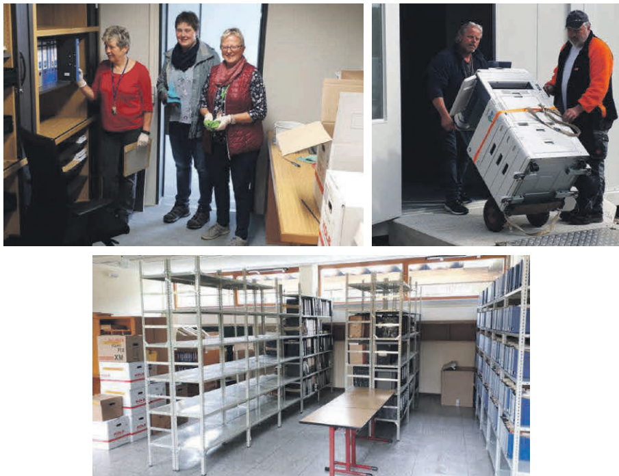
Ein Großteil der Akten und des Archivs wurden in einem Klassenzimmer der Grundschule untergebracht.

Während der Sanierungszeit finden die Gemeinderatssitzungen im Filialistenraum direkt am Eingang der Grundschule statt.