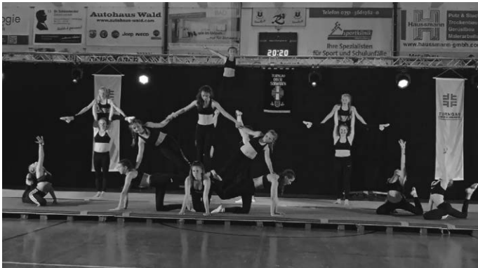
Turnshow „Best of“