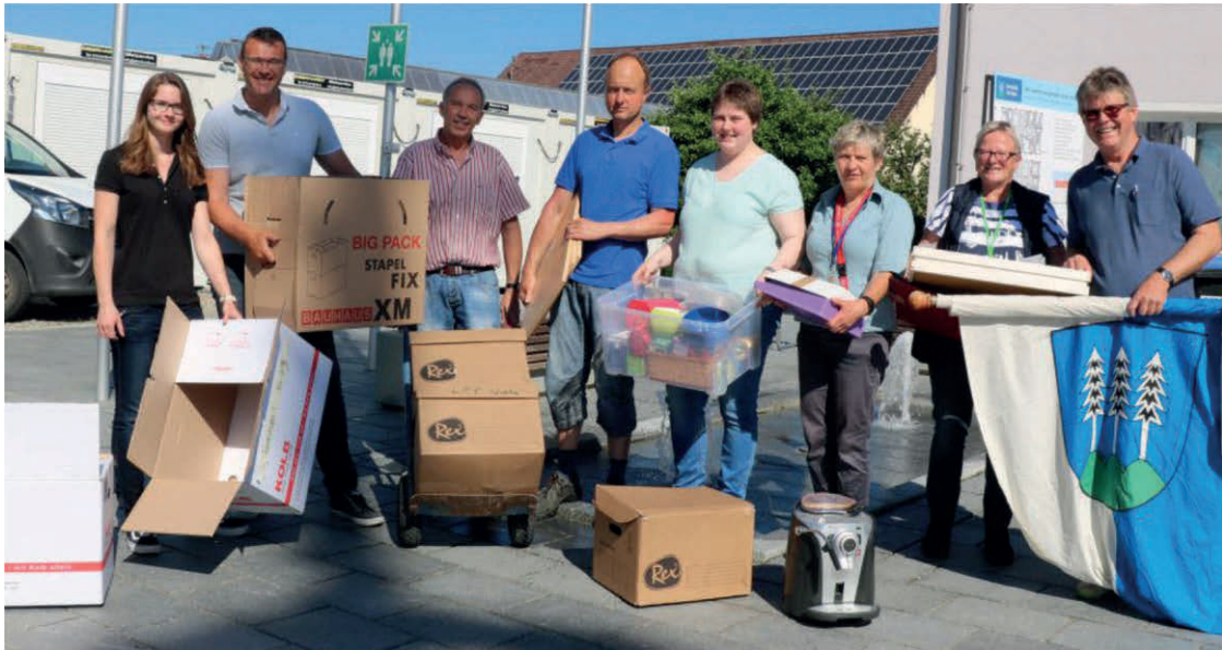
Intensive Tage des Einpackens, Transportierens und Einräumens für alle Gemeindebediensteten bei sommerlicher Hitze