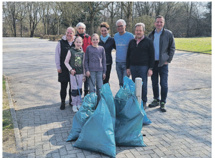
Auch die Erwachsenen haben an der Flurputzete mitgeholfen.