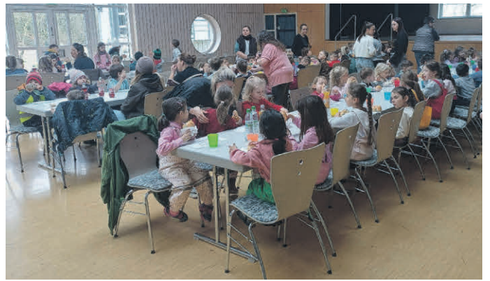
Im Anschluss trafen sich alle im Dorfgemeinschaftshaus für ein kleines Vesper.