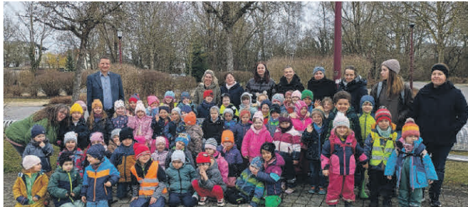
Die Kindergartenkinder sammelten den Müll aus dem Rehgarten ein.