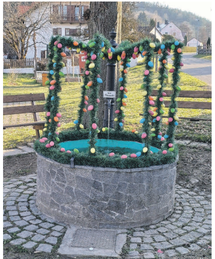
Osterbrunnen in der Mühlbergstraße