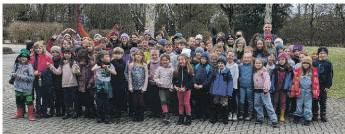
Die Schülerinnen und Schüler der Montessorischule Tannheim beteiligten sich ebenfalls engagiert an der Flurputzaktion und sammelten fleißig Müll.