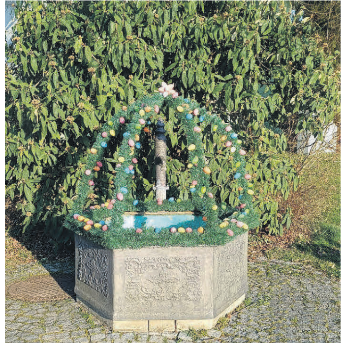
Osterbrunnen in der Eggmannstraße