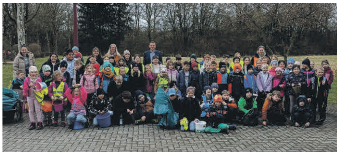
Auch die Grundschule Tannheim trafen sich mit ihren Klassen zum Sammeln.