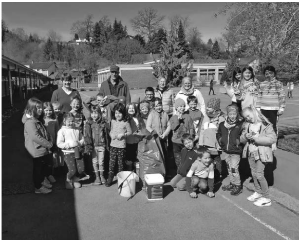
Die 1. Klasse der Grundschule Tannheim hat fleißig mit-gesammelt.

Die restlichen 14 Strecken wurden im Laufe der folgenden Woche in Kleingruppen, bei trockenem Frühlingwetter, vom Müll befreit. Alle Beteiligten hatten schon im Vorfeld die Routenpläne und die Müllsäcke bekommen und die vollen Säcke konnten dann im Bauhof abgestellt werden. Leider mussten wir auch dieses Jahr wieder feststellen, dass vor allem die Waldgebiete in Richtung Rot an der Rot als Müllablageplatz benutzt werden. Autoreifen, ein 2 m langes Karosserieteil, 16 blaue Säcke mit Bauschutt, Farbdeckel, alte Schuhe und vieles mehr war im Wald entsorgt worden, berichtete Gerhard Preinl von seiner Tour. Unser Ziel, dass wir die Gemeinde sind in der am wenigsten weggeworfen wird, kann durch solch rücksichtsloses Verhalten mancher Menschen nicht erreicht werden.