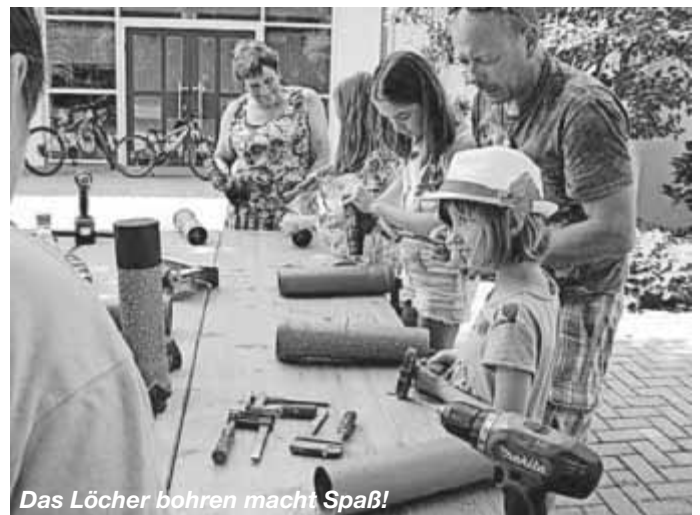
Das Löcher bohren macht Spaß!