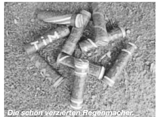
Die schön verzierten Regenmacher.