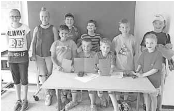
Diese Kinder nahmen teil am Kinderferienprogramm in Tannheim, Schach 2016

Im Rahmen des Kinderferienprogramms in Tannheim bot unser Schachclub den Kindern eine Einführung in das „Spiel der Könige“ an. Die Kinder lernten, wie man das Schachbrett aufbaut und die Figuren richtig aufstellt, wie man mit den jeweiligen Figuren zieht und wie man den Gegner schachmatt setzen kann. Wichtig für die Kinder war es, auch die weiteren Grundregeln des Schachs, so zum Beispiel „Berührt, geführt!“, zu erfahren. Da die Schachregeln so klar und eindeutig sind, dürfte es in den zukünftigen Partien mit Freunden, Eltern oder Großeltern nun keine Diskussionen mehr geben. Zum Schluss erhielten alle Kinder ein Merkblatt, auf dem sie das Gelernte jederzeit nachschauen können – damit das Kinderferienprogramm 2016 des Schachclub Kirchdorf nicht in Vergessenheit gerät.