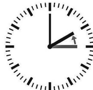
Umstellung Herbst Uhr wird zurückgestellt