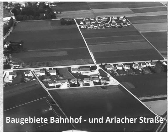
Baugebiete Bahnhof - und Arlacher Straße