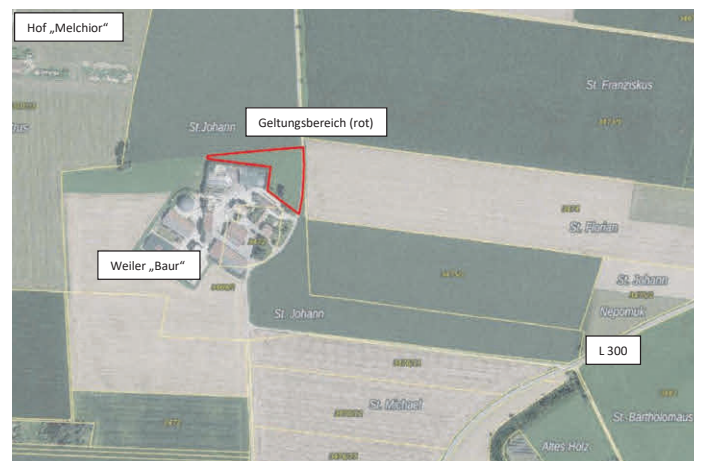
Räumliche Lage des Geltungsbereichs des Bebauungsplans – Luftbild (ohne Maßstab)

Alle Betriebe erzeugen aktuell bereits Biogas (als Einzelbetrieb bzw. in Zusammenschlüssen). Das produzierte Biogas soll von den Einzelbetrieben an den Standort der Biogasanlage auf dem landwirtschaftlichen Weiler „Baur“ geführt und dort zu Biomethan aufbereitet werden. Dieses wird von den Stadtwerken Memmingen abgenommen und in das öffentliche Gasnetz eingespeist. Im Aufbereitungsprozess als Nebenprodukt entstehendes CO 2 wird separat vermarktet. Durch die geplante Anlage können etwa 4.000 Haushalte jährlich mit nachhaltiger, emissionsarmer Energie versorgt werden.