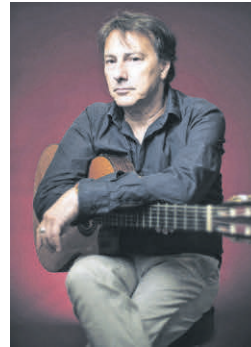
Der Künstler Pippo Pollina.

Am Samstag, den 09. November um 19:30 Uhr laden zwei faszinierenden Künstlerinnen in der Stadthalle Biberach auf rauschende Bälle und magische Inseln ein, an die Küste von Neapel und in das weihnachtliche Paris. Tauchen Sie ein in die spannende Welt der Lieder von Loewe, Meyerbeer und Schumann. Erleben Sie einen beschwingten und abwechslungsreichen Abend mit Opernklassikern, Juwelen der Operette sowie Lied-Neuentdeckungen, die weltweit zum ersten Mal erklingen werden.