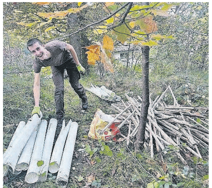
Die Schutzhülsen und Stabilisierungs-Stäbe werden zum Recycling gesammelt.