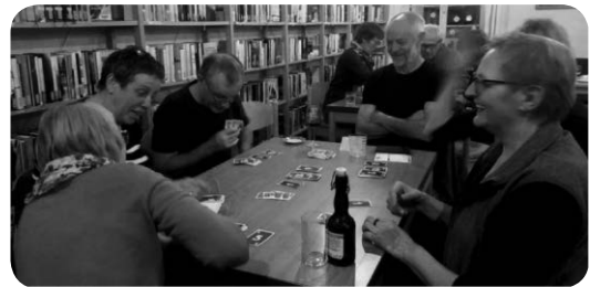
Vergnügliche Runde beim Spieleabend in der Bücherei mit leckerem Buffet dank unserer fleißigen Mitarbeiter/innen.