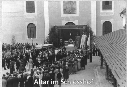
Altar im Schlosshof

gel das Lied „Groer Gott wir loben dich“ anstimmte, die Kirchenglocken und das Gelute der Ministranten dazukamen, sangen die Glubigen aus vollem Herzen