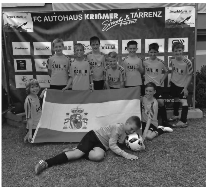
E3 SGM Iller/Rot