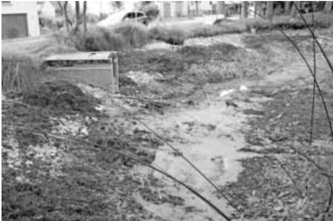
vor der Entschlammung

Vor wenigen Tagen wurde die Sanierung des Oberen Weihers abgeschlossen. Der Damm erhielt eine Lehmabdichtung und wurde mit einem Biberschutzgitter versehen.