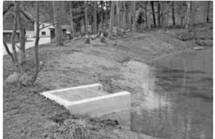
nach der Sanierung von Weiher und Mönch