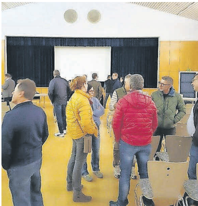
Angeregte Gespräche im Anschluss an die Veranstaltung.