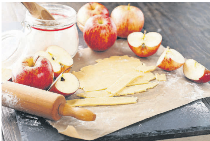
Am Sonntag, 27. Oktober können Hobbybäcker ihr bestes Apfelrezept im Oberschwäbischen Museumsdorf Kürnbach präsentieren.