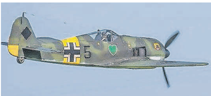
Das Siegermodell: Die Focke Wulf FW 190 A5 im Maßstab 1:4.