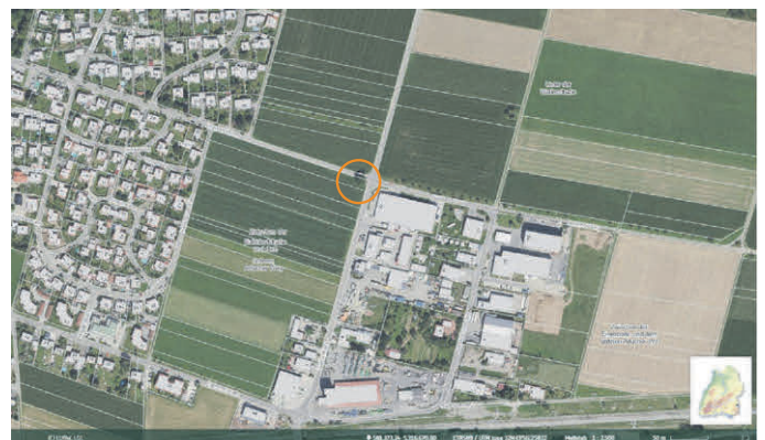
Anhang 1: Lage des Naturdenkmals „Esche am Feldkreuz“ in der Flurkarte M 1:2.500.