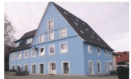
Freundeskreis Blaues Haus Tannheim

Für die Asylbewerber im Blauen Haus benötigen wir Bekleidung für Männer und Jugendliche in den Größen 46 – 48 (Hosen, Jacken, Pullover und T-Shirts). Wer hier mit gut erhaltenen Sachen helfen kann, melde sich bitte bei: