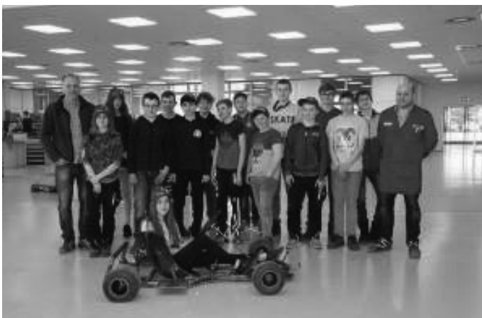
Gemeinsam mit Schülerinnen und Schüler der Abt-Hermann-Vogler-Schule entwickeln Liebherr-Azubis fahrtüchtige Gokarts.

Zwei der Schülerinnen verlängerten ihr Schnupperpraktikum bei Liebherr, um einen tieferen Einblick in das Berufsbild eines Industriemechanikers zu erhalten. Nach dem die Motoren der Gokarts montiert und auch die letzten Arbeiten abgeschlossen sind, werden die Schülerinnen und Schüler der Abt-Hermann-Vogler-Schule an der Festhalle in Rot an der Rot ein Gokart-Rennen veranstalten.