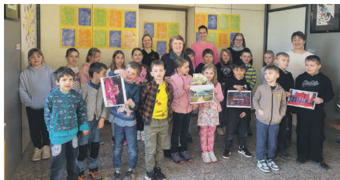
Die Kinder und das Team der Grundschule Tannheim