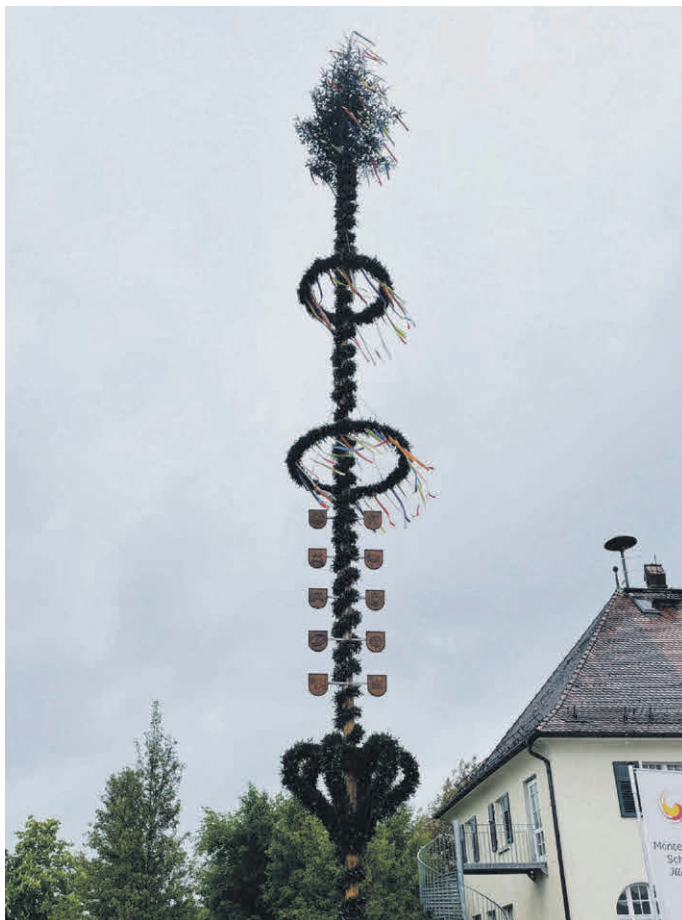
Maibaum auf dem Rathausplatz.