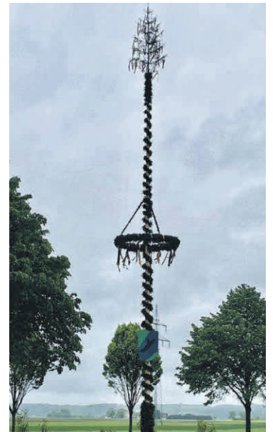
Maibaum in Egelsee.