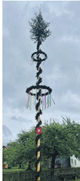
Maibaum im Ortsteil Arlach.

Als Frühlingsbote und lieber Gruß an die Angebetete entstand die Tradition vom Stellen eines Maibaums schon im 16. Jahrhundert. Die Tannheimerinnen und Tannheimer sind dieser Tradition dieses Jahr gleich an vier verschiedenen Stellen in der Gemeinde nachgekommen. Nicht nur die Feuerwehr übernahm das Stellen, sondern die Einwohner der jeweiligen Ortsteile packten fleißig gemeinsam an. Gilt Tannheim damit als frühlingshaftestes Dorf im Illertal?