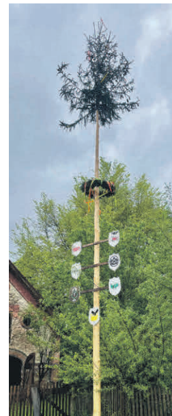
Maibaum im Ortsteil Kronwinkel.

„Auch ich persönlich freue mich über die gelebte Tradition in der Gemeinde. Ob großzügig geschmückt oder bewusst zurückhaltend – jeder Maibaum steht für unser Miteinander und die Verbundenheit zur Heimat. Gerade im Festjahr unterstreicht diese gelebte Tradition, wie wichtig uns Zusammenhalt und Brauchtumpflege sind“, so der Bürgermeister.