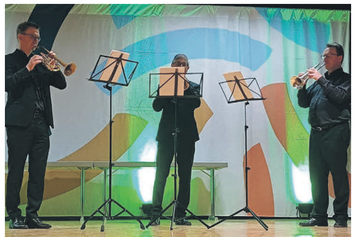
Für musikalische Umrahmung sorgte das Trompetentrio der Bruno-Frey-Musikschule in Biberach