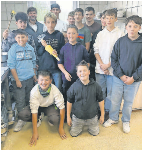
Gemeinsam bereiten die Schüler der Abt-Hermann-Vogler Schule in der Küche des Gasthaus Ochsen die geernteten Kartoffeln zu.

jungen Menschen ihren Start ins Berufsleben erleichtern wollen. Wenn wir das mit einem leckeren Kartoffelgericht machen können, freut uns das umso mehr.“ Im nächsten Jahr sollen dann Bohnen und Kürbisse im Schulgarten angebaut werden - bis zu der Verarbeitung dieser Produkte sollte die Schulküche aber wieder einsatzbereit sein.